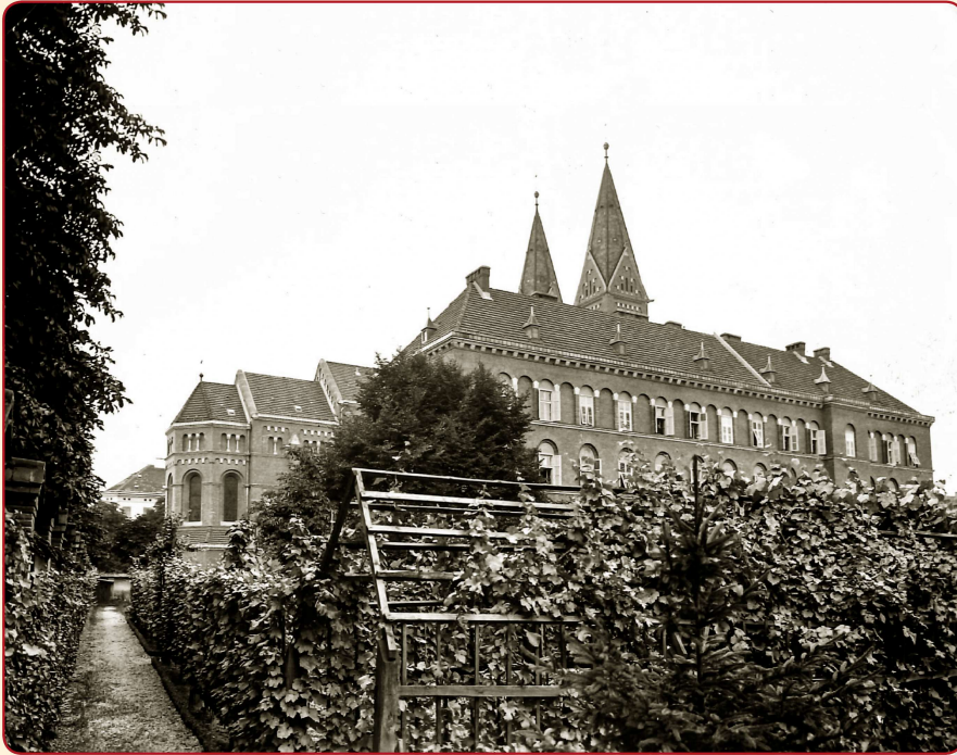
1930, samostan z vrtnom